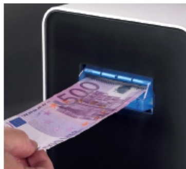
Acepta y verifica todos los billetes, incluyendo el de 500 €