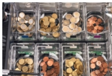
Cada moneda tiene su propio hopper Máxima fiabilidad y rapidez