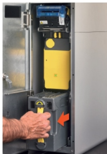
Recaudación de billetes en un módulo cerrado. Nadie ve ni toca el dinero